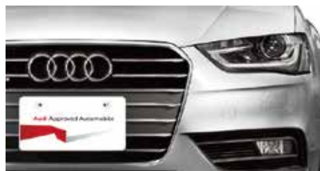
店頭車両のこのプレートが目印

新車保証の残期間がある場合は残期間終了後、 残期間がない場合は 中古車登録から1年間保証します。 延長保証にご加入いただくと、合計2年間保証します。