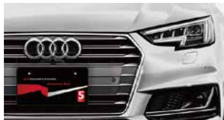
店頭車両のこのプレートが目印